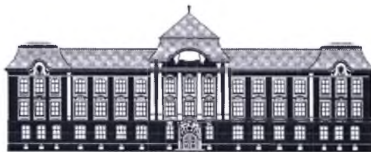
COLEGIUL NAȚIONAL "CONSTANTIN DIACONOVICI LOGA" PRIMUL LICEU CU PREDARE ÎN LIMBA ROMÂNĂ DIN CAPITALA BANATULUI